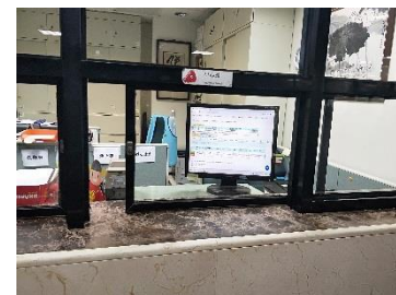
同學現場檢視資訊系統歸還狀態