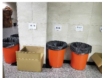
同學將畢業服擲入回收桶