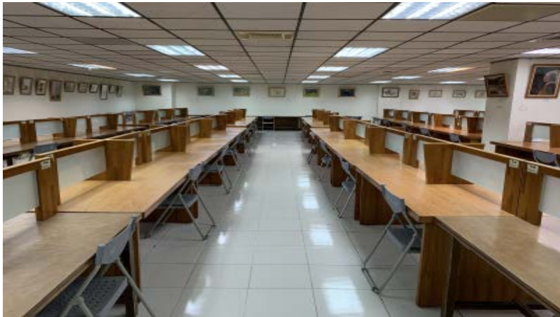
圖書館四樓(上圖)與學生宿舍B1(下圖) 採梅花座方式控管自修座位